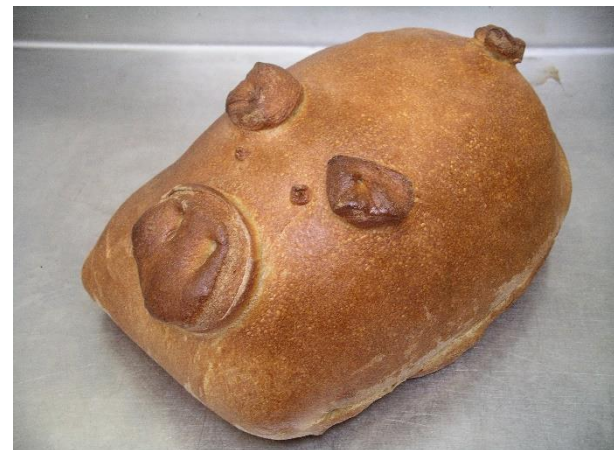
Schinken im Teig